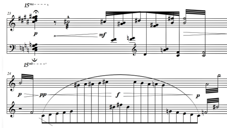
Figura 7 Notas preparadas: amálgama e contraste

Esperamos que as reflexões apresentadas neste artigo diminuam a distância entre teoria musical e pesquisas experimentais em cognição musical, possibilitando a realização de pesquisas cujos resultados tragam contribuições para estes dois domínios.